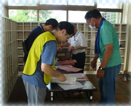
受付作業を進めます。

今回の訓練ではみなさんから、ここをもっとこうしたら? とか、雨の日はスムーズにできるの?とか... 今後、参考にしていかないといけない意見や感想を たくさんもらいました。 みなさんの声を取り入れながら、 防災訓練を地域にひろげていきたいと思っています。